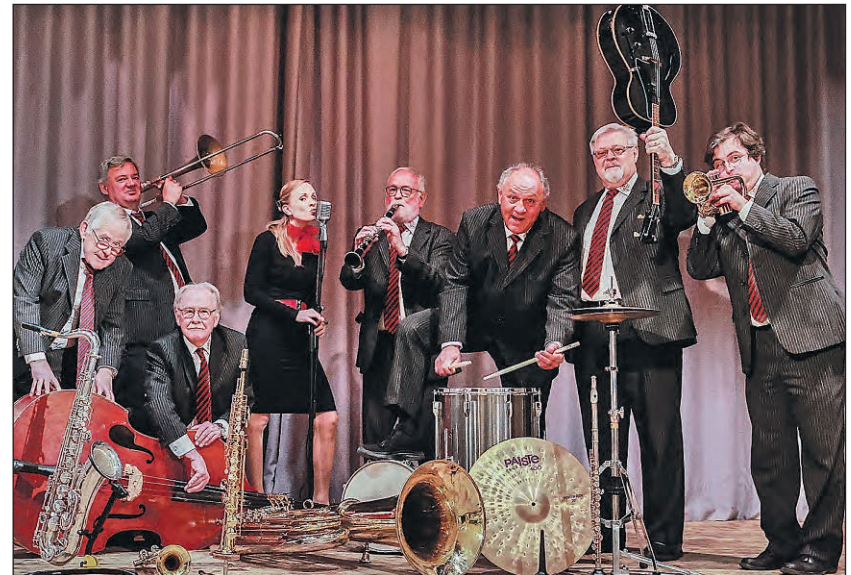
Die Bridge Pipers umrahmen das Waldfest der Musikgesellschaft Teufenthal-Unterkulm vom kommenden Wochenende.